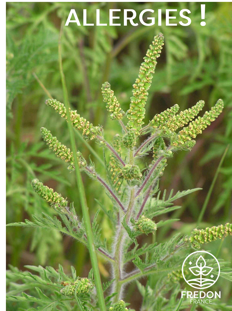
AMBROISIE À FEUILLES D'ARMOISE